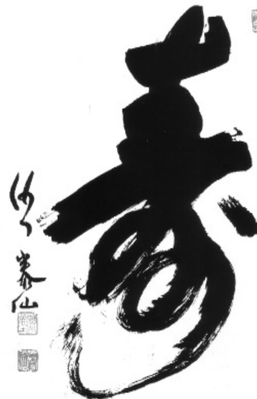
Le souffle du cosmos